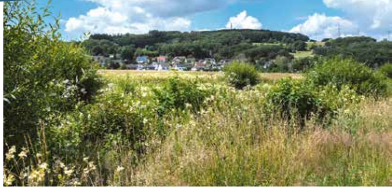
Dickersbach © Maria Mensching

kümmern. Während nebenan eine neue Brücke gebaut wird, nimmt auch das kleine Bethäuschen wieder Gestalt an: Es wird neu eingesegnet und schmückt erneut den Wegesrand – bis zur nächsten Generalüberholung Mitte der 1990er Jahre. Zuletzt von Grund auf saniert wird die Kapelle im Jahr 2011. Denn in diesem Sommer feiert man an der Sieg das 750-Jährige Bestehen von Bourauel. Dafür putzt sich der Ort heraus und auch das kleine Bethäuschen soll wieder in neuem Glanz erstrahlen. In Anlehnung an die kleine Kapelle hieß unser Wahlspruch damals: „Wir sind Kapelle!“