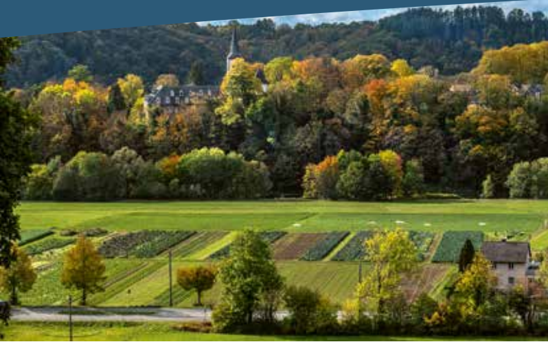
Merten © Maria Mensching