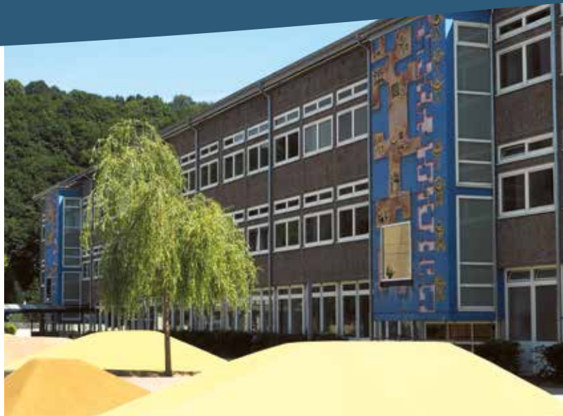
Siegtal gymnasium © Klaus Wahl