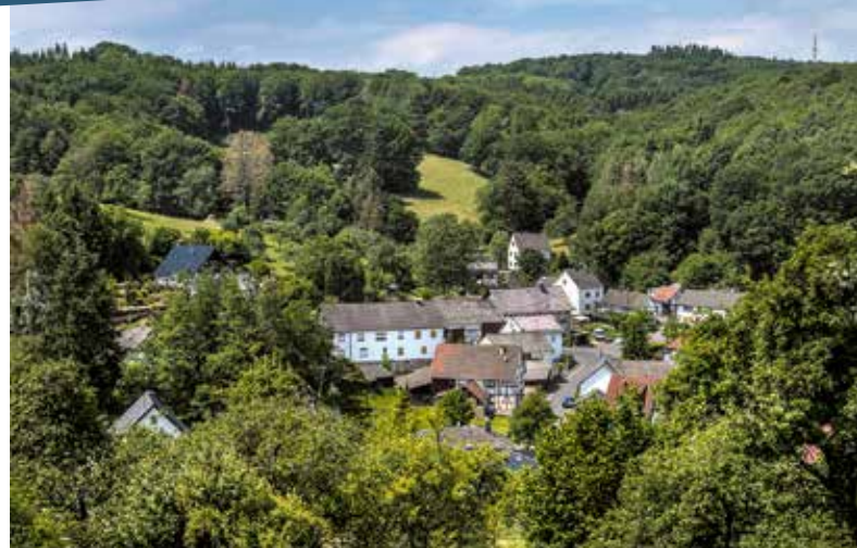
Bitze © Maria Mensching