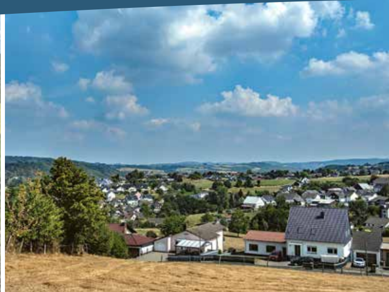
Schiefen © Maria Mensching

Wer Rodder und Hecke sucht, muss schon einen besonderen Grund haben, denn hier ist die Welt zu Ende. Selbst manch alt-ingesessener Eitorfer spricht spöttisch von „denen da oben am Berg“. Die kleinen Orte liegen gut versteckt am Waldrand, abseits der Durchgangsstraßen, nahe der Landesgrenze im Süden. Bedeutende Gebäude wie Kirchen, Klöster oder andere prachtvolle Bauten wird man hier vergebens suchen, ebenso wie Gaststätten oder Geschäfte. Nur wenige ältere Fachwerkhäuser sind noch erhalten und zeugen von 500 Jahren Geschichte. Stattdessen findet man Ruhe und viele Wanderwege durch ein herrliches Waldgebiet rund um den „Hohen Schaden“ (stolze 388 m Höhe!) mit Schutzhütten und Rastplätzen, die Wanderern und Radfahrern Erholung in ungestörter Natur bieten. Aber auch Feiern hat bei den gut 100 Einwohnern Tradition: Zu besonderen Anlässen treffen sie sich mit ihren Freunden zu einem Fest in der Eichenbitze oberhalb von Rodder, wo Getränke und Gegrilltes in der Kühle des Waldes besonderen Genuss versprechen.