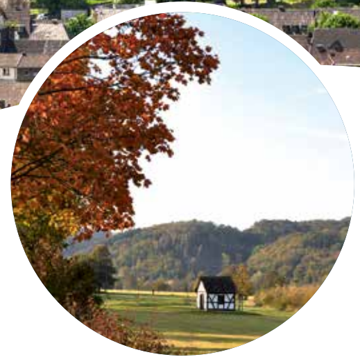
Kapelle Alzenbach