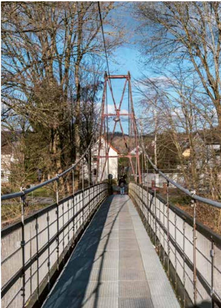
Halft © Maria Mensching

kümmern. Während nebenan eine neue Brücke gebaut wird, nimmt auch das kleine Bethäuschen wieder Gestalt an: Es wird neu eingesegnet und schmückt erneut den Wegesrand – bis zur nächsten Generalüberholung Mitte der 1990er Jahre. Zuletzt von Grund auf saniert wird die Kapelle im Jahr 2011. Denn in diesem Sommer feiert man an der Sieg das 750-Jährige Bestehen von Bourauel. Dafür putzt sich der Ort heraus und auch das kleine Bethäuschen soll wieder in neuem Glanz erstrahlen. In Anlehnung an die kleine Kapelle hieß unser Wahlspruch damals: „Wir sind Kapelle!“