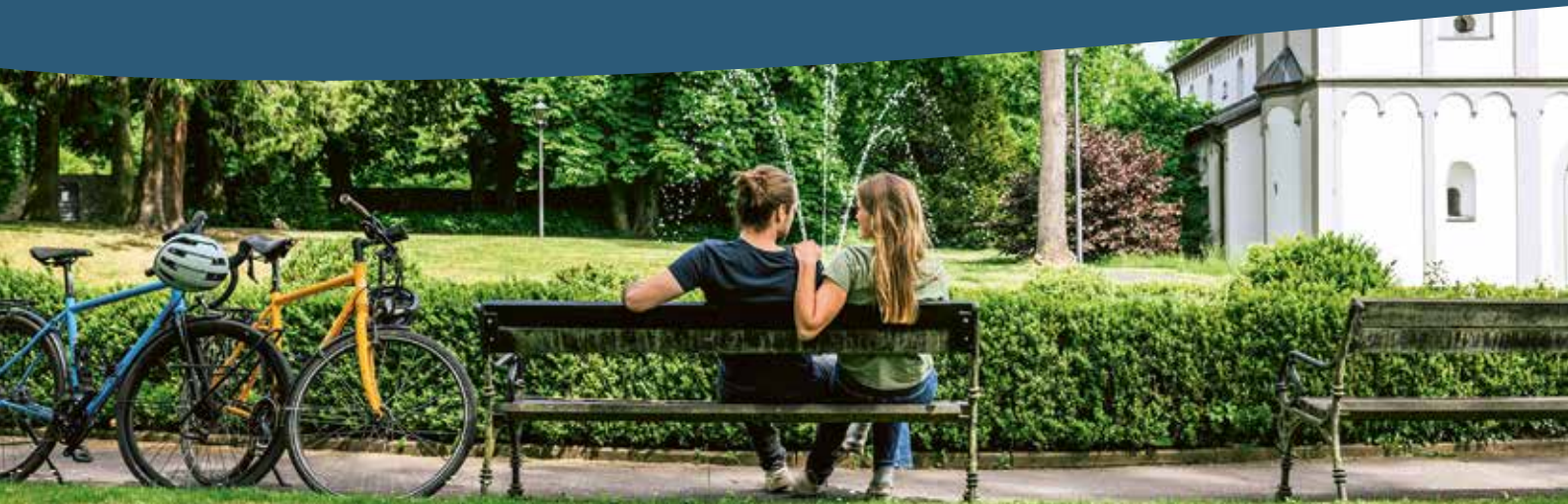
Radfahrer vor Klosterkirche St. Agnes Merten

Die zahlreichen Erlebniswege der Naturregion Sieg bieten mit Info-Stationen interessante Einblicke in das Leben der Menschen und die Geschichte der Region.