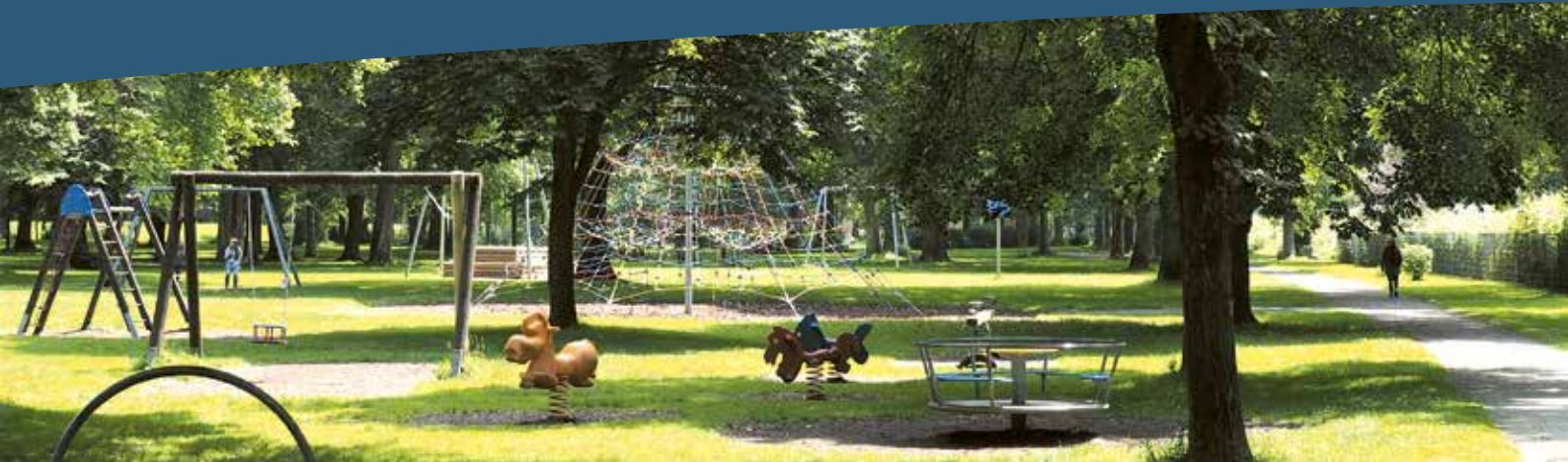
Spielplatz Siegpark