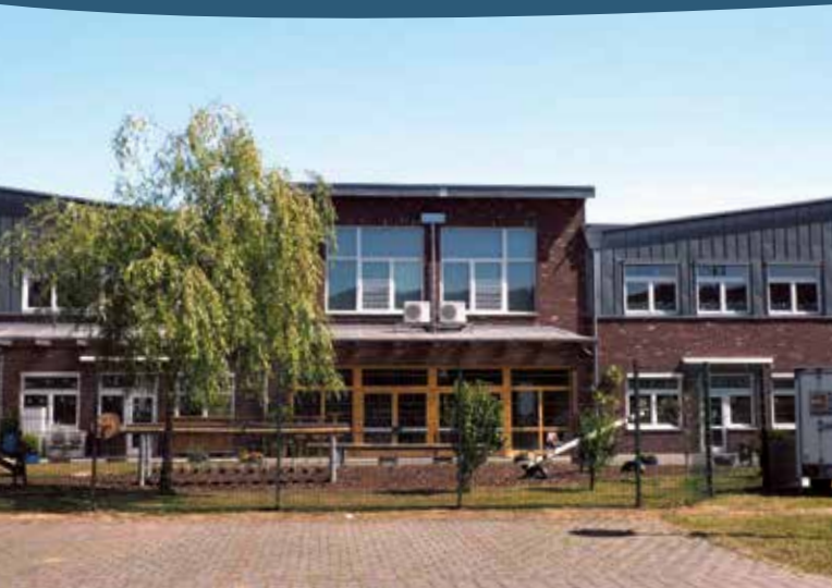
Gemeinschaftsgrundschule Alzenbach