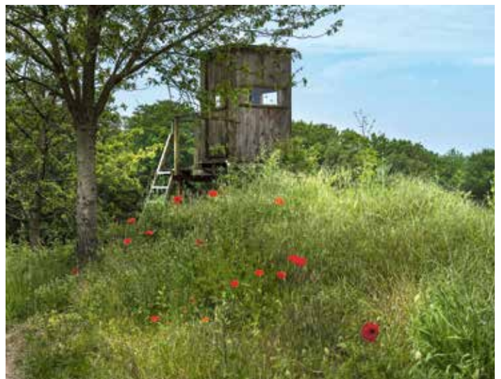
Rodder, Hecke, Dickersbach © Maria Mensching

Schiefen liegt am Westhang des mittleren Erlenbachtals. Südlich wird Schiefen vom Golfplatz „Heckenhof“, im Westen von Feldern, Wiesen und Wald und im Norden von Untenroth begrenzt. Archäologische Funde deuten auf einen lokalen Rittersitz im hohen Mittelalter hin. Schriftlich erscheint der Name zunächst im Jahr 1595 in den Pachtakten des Schwarzrheindorfer Hofes zu Obereitorf mit dem Pächter „Classen Sohn zu Orseiffen“. In der Mühlenurkunde des Grafen Nesselrode wird im Jahr 1597 dann aber bereits der Name „Schiefen“ genannt. Heute stehen in dem Ortsteil zahlreiche Fachwerkhäuser, die liebevoll gepflegt werden. Die Traditionspflege wird in diesem Teil Eitorfs groß geschrieben. So finden beispielsweise jedes Jahr das traditionelle Pfingsteiersingen, der traditionelle Pfingsteierverzehr und das seit den 1980er Jahren bekannte Kartoffelfest statt. Weitere Aktivitäten werden auf der Homepage der Dorfgemeinschaft Schiefen e. V. vorgestellt. Durch Schiefen führt der insgesamt 169 km lange Wanderweg „Rhein-Ruhr-Weg X9“ von Dortmund bis Königswinter. Dieser Weg führt über die Schiefener Straße hoch zum Dellborn und dann ins Krabachtal. Vom Dellborn aus hat man das ganze Jahr über eine gute Sicht über Eitorf, das Siegtal sowie über den nördlich von Schiefen gelegenen Höhenzug.