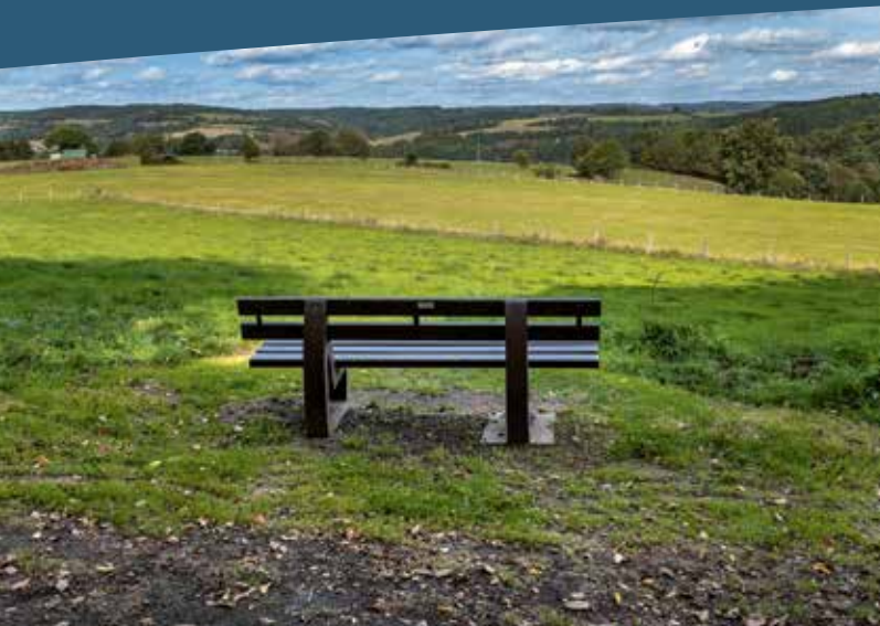
Rodder, Hecke, Dickersbach © Maria Mensching

Ottersbach e. V. gestaltet in jedem Jahr einen Tanz in den Mai sowie das zur Tradition gewordene Maifest, Pfingsteiersingen und den Eierverzehr. Die Umgebung ist ein Wanderparadies mit wunderschönen Wäldern, Höhen und Tälern der Nutscheid.